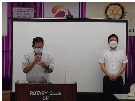
本日のゲスト案内