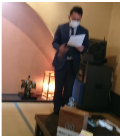
理事会開催案内 11月17日 11時30分より