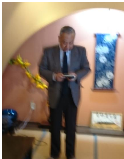
60周年実行委員会 の開催案内