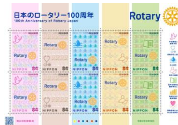
日本ロータリー100周年切手↑