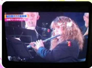
2013年 「ふなばし千人の音楽祭」