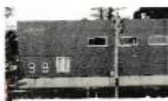
貸工場整備事業 セバレータデザイン株式会社