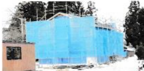
エコタウン構のモデル住宅