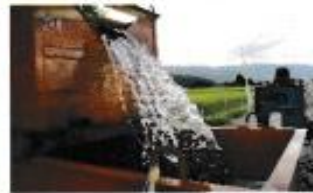
中浄水場の取水風景