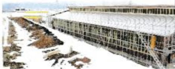
東北おひさま発電のバイオガス発電施設